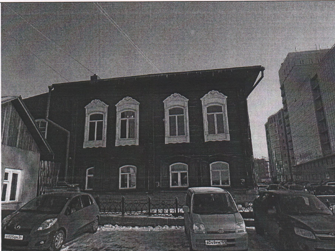
Фото № 3. Западный фасад.