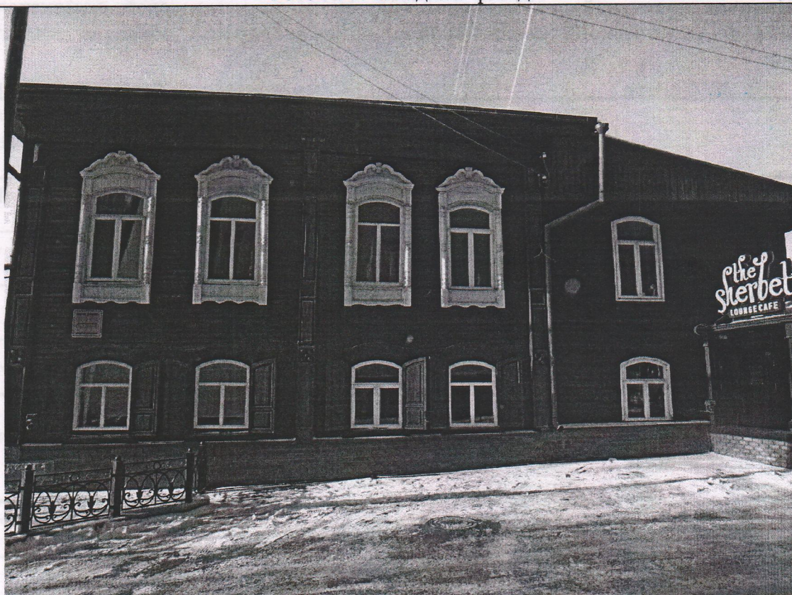
Фото № 4. Восточный фасад.