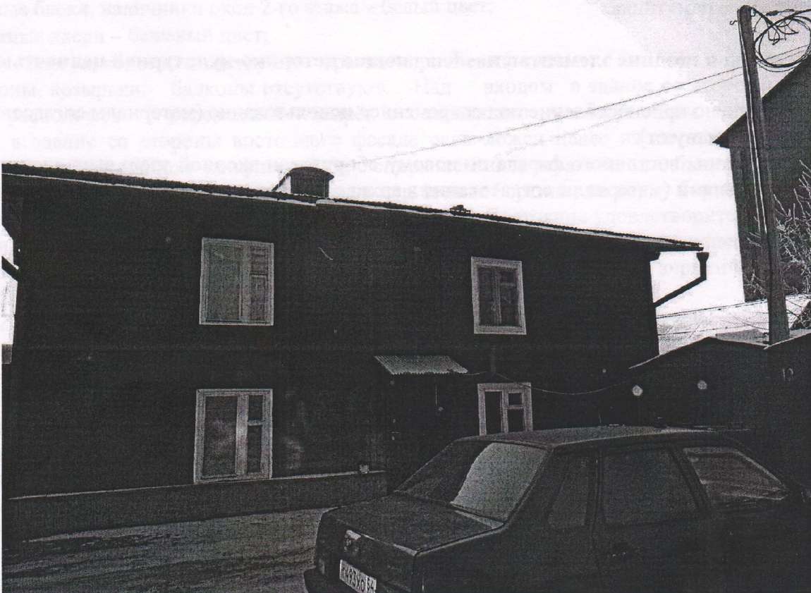
Фото № 2. Северный фасад