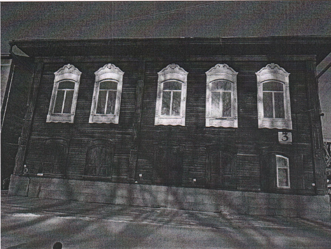
Фото № 1. Южный (главный) фасад со стороны ул. Коммунистическая